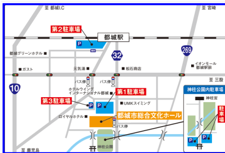
都城市総合文化ホール MJ(駐車場完備)