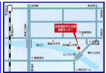
日向地区中小企業技能センター(駐車場完備)